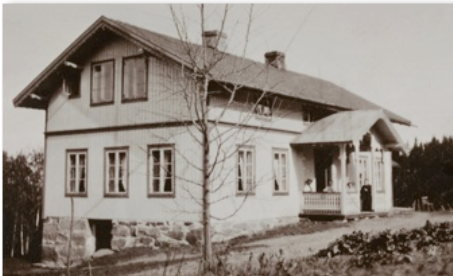
Østenstad skole (også kalt Østre skole ) fotografert før inngangspartiet brente og bygget ble revet. Deler av panelet ble snudd og brukt på nytt da gården ble bygd opp igjen i 1936.