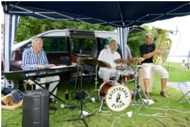
Skitthegga Swing skapte fin stemning.

Mange aktiviteter ga liv og røre på stranda.