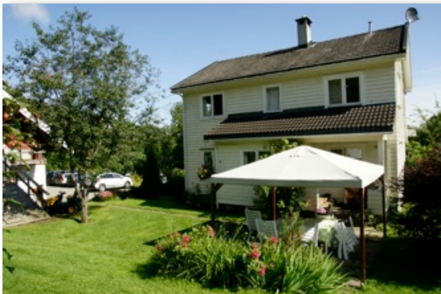
Slik ser gården ut i dag, fotografert under bringebærinnhøstingen i 2010.

disse. Da hevet den lærde professor blikket over brillene, kom ned mot Niels og sa: "Askerbær, dem kan man selge i Asker."