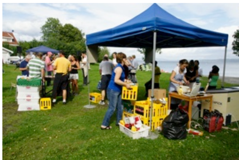
Arnestad skolekorps sine burgere og brus gikk unna!