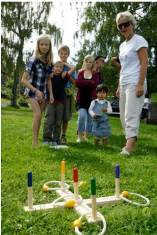
Unni Musum holder orden på det populære ringspillet. Neste gang må vi ha flere ringspill!

Værgudene var sånn passe snille med oss, da vi 21. august inviterte til familiefest på Fritznerstranda. Det kunne vært litt varmere både på land og i vannet, men regnet holdt seg i det minste unna.