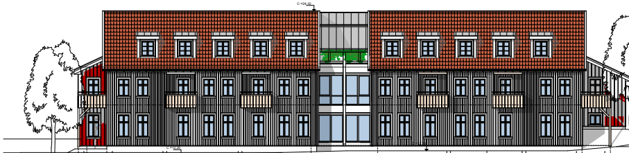
Fasade mot Sjøen

Midt i sjarmerende Vollen kan du snart åpne din egen butikk, skape din egen framtid og være med å påvirke miljøet. Lokalet kan tilpasses etter ditt ønske, mellom 50 og 150 kvadratmeter. Ring!