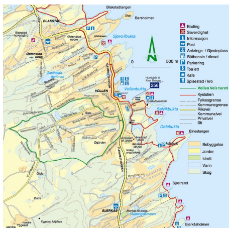
kart: Sigurd Sandtveit/Asker Reklame

Rutetider for buss, tog og hurtigbåt er også der, litt historisk stoff, flere bilde-serier, kontaktinformasjon, oversikt over lag og foreninger, lokaler til utleie, hvem som er rodeledere i velveiene (og dermed din kontaktperson) - samt selvfølgelig kontaktinformasjon for styret. Du finner også stoff og bilder fra Vollen—inkludert historisk materiale. Referat fra styremøter og årsmøter og regnskaper ligger også tilgjengelig.